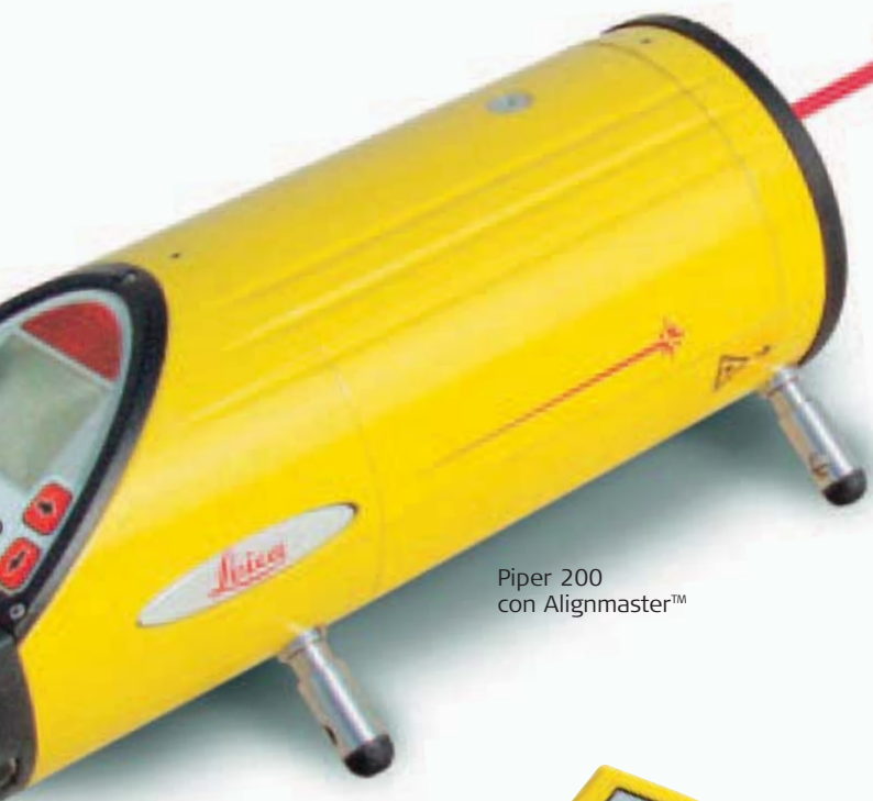
Piper 200 con Alignmaster™

Sistema patentado de localización automática de la señal de puntería, útil para utilizar el mismo estacionamiento al día siguiente.