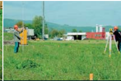
Nivelación de superficies

Leica Jogger 20/24 son socios ideales para sus trabajos diarios de nivelación.