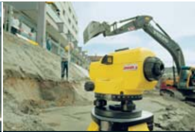
Mediciones de perfil