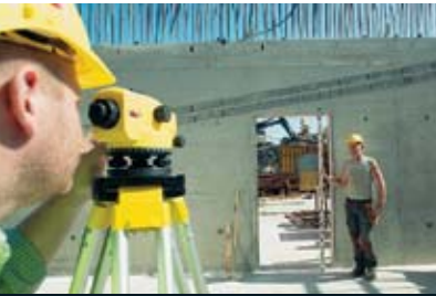
Excavaciones y cimentaciones

Niveles automáticos – Preparados para funcionar en todo momento.